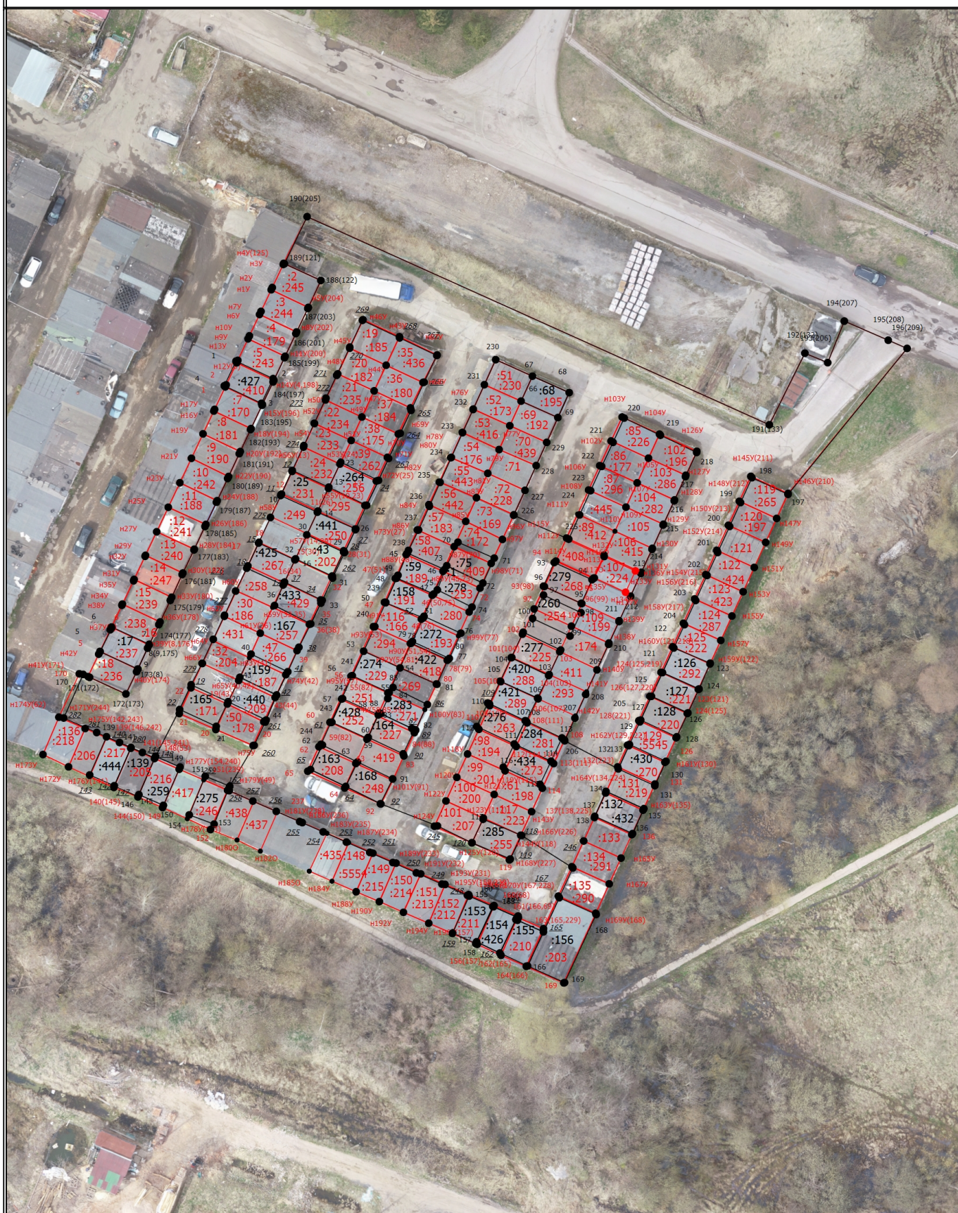
Схема границ земельных участков