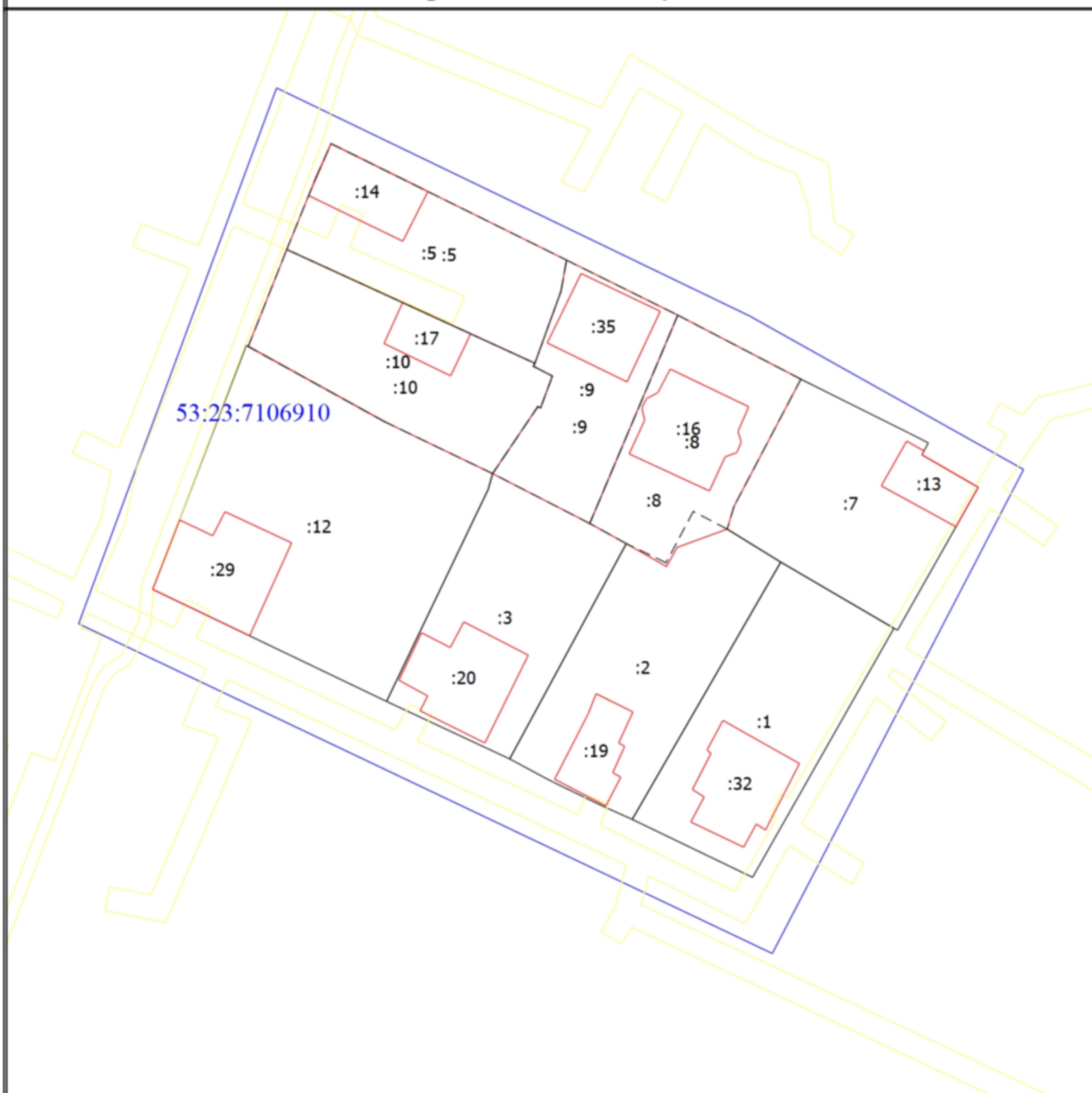
Схема границ земельных участков