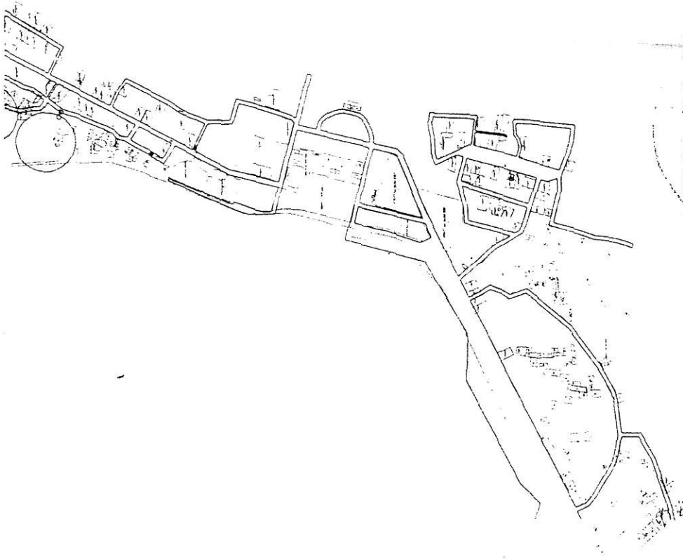
Схема расположения земельного участка на кадастровой карте квартала 53:23:9120000: по адресу: улица Михайловская, д. 1а; площадь: 248 кв. м.